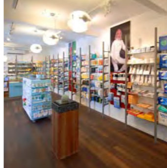
Wyland Apotheke, Andelfingen

Klar strukturiert, übersichtlich, natürliche Materialien: Die Wohlfühlapotheke