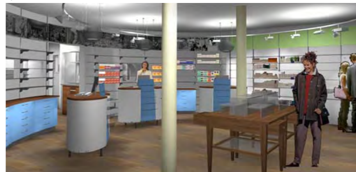
Apotheke Susten, Susten

Die Aufmerksamkeit Ihrer Kunden lässt sich durch eine geschickte Ladengestaltung beeinflussen. Wir beraten Sie und erarbeiten gemeinsam mit Ihnen die künftigen Schwerpunkte sowie Ausrichtung und Stil Ihrer »neuen« Apotheke. Realitätsnahe Visualisierungen unterstützen den Findungsprozess. Ein Umbau benötigt meist weniger finanzielle Mittel als Sie erwarten. Was vor allem zählt, sind gute Ideen und eine professionelle Umsetzung.